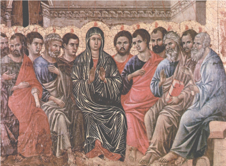
Pentecost , Panel from the Maesta Altarpiece of Siena, Duccio di Buoninsegna (1308-1311)