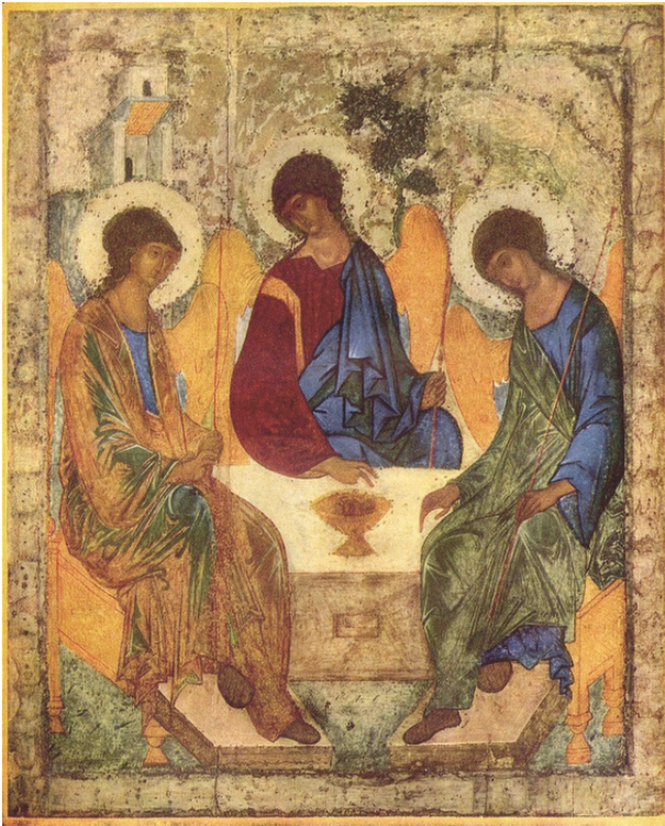
Holy Trinity, icon Andrei Rublev (1400)