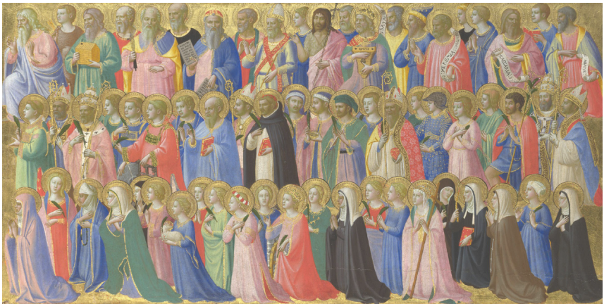
Forerunners of Christ with Saints and Martyrs Fra Angelico (1423-1424)