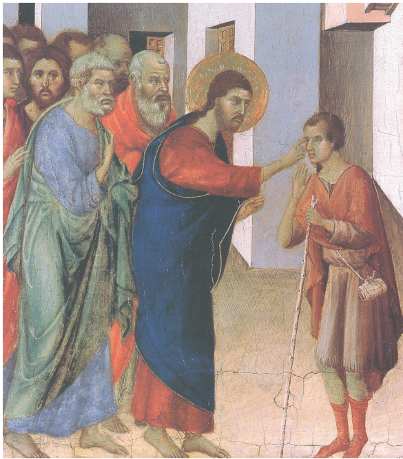
Healing the Blind Man (detail), Duccio di Buoninsegna (1308-1311)