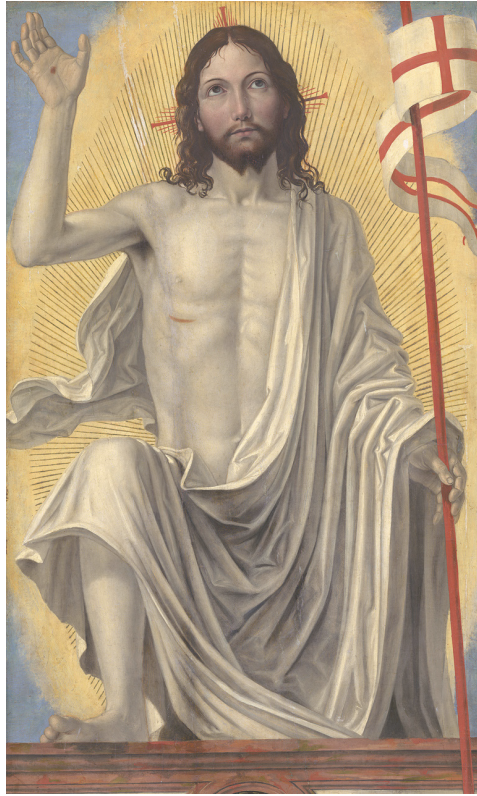
Christ Risen from the Tomb, ca. 1490, Ambrogio Bergognone

DOMINGO de PASCUA de la RESURRECCIÓN del SEÑOR