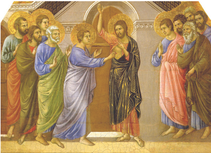
The Incredulity of Thomas, Maesta-Altarpiece, Sienna Duccio di Buoninsegna, 1308