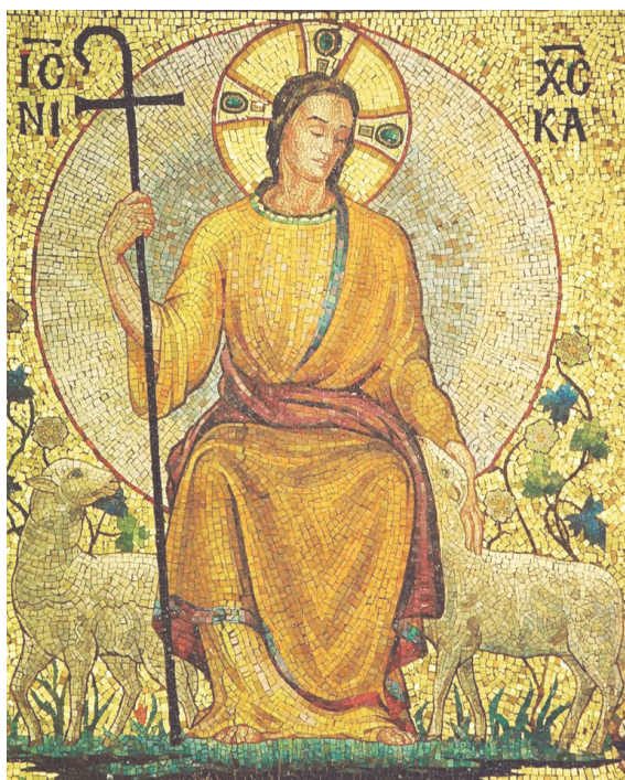
The Good Shepherd, mosaic, Basilica of the National Shrine of the Immaculate Conception, Washington, DC