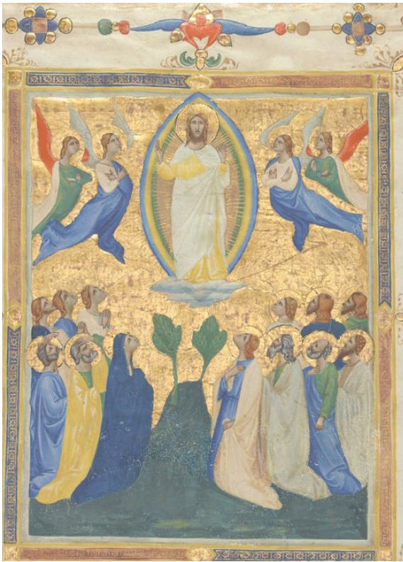
The Ascension of Christ Laudario of Sant' Agnese, Pacino di Bonaguida, c. 1340