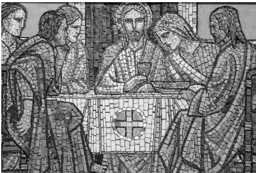
Christ Institutes the Eucharist by Lawrence OP (Detail from a mosaic in St Salvators Chapel in St Andrews), 2013